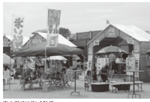
海水浴でにぎわう砂浜

平成29年7月15日の土曜日に、葛蒲田海水浴場がフルオープンしました。本格的な海開きは東日本大震災後7年ぶり。当日は多くの家族連れなどにぎわいをみせました。