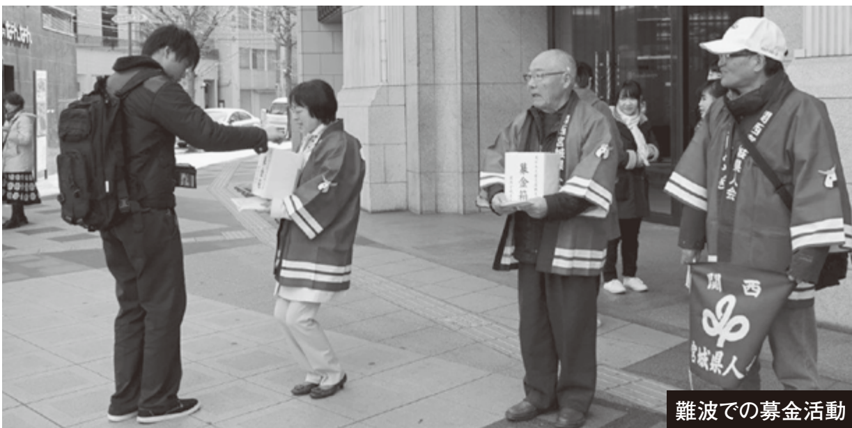
難波での募金活動