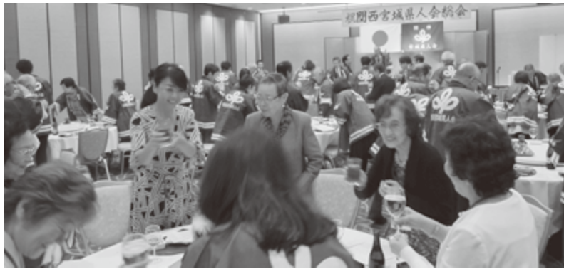
楽しめる参加者のみなさん