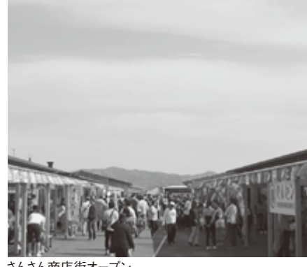
さんさん商店街オープン

この葛蒲田海水浴場は、明治21年に日本で3番目の海水浴場として開設されました。夏の海水浴場シーズンになると多くの海水浴客が訪れる県内随一のリゾートとなっています。 平成22年には、5万人を超える海水浴客が訪れていましたが、東日本大震災により葛蒲田海水浴場は様相を一変。押し寄せた津波で防潮堤は崩れ、砂浜にはコンテナやボート、漁網等が流れ着き、荒れ果てて海水浴どころではなくなっていました。