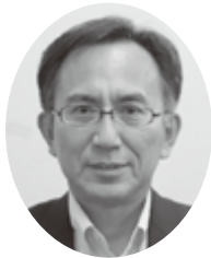
宮城県大阪事務所所長 (関西宮城県人会事務局長)