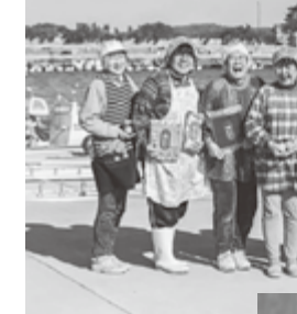
がんばる浦戸の母ちゃん会の皆さん