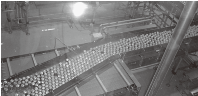
ビールの製造工程

婦人部会、事業部 会合同による日帰り 旅行が左記実施要 領にて実施されまし た。当日は大型の台 風が接近してしまし たが、荒天になるこ とはなく、何とか無難 に過ごさせていただ いたことを報告しま す。