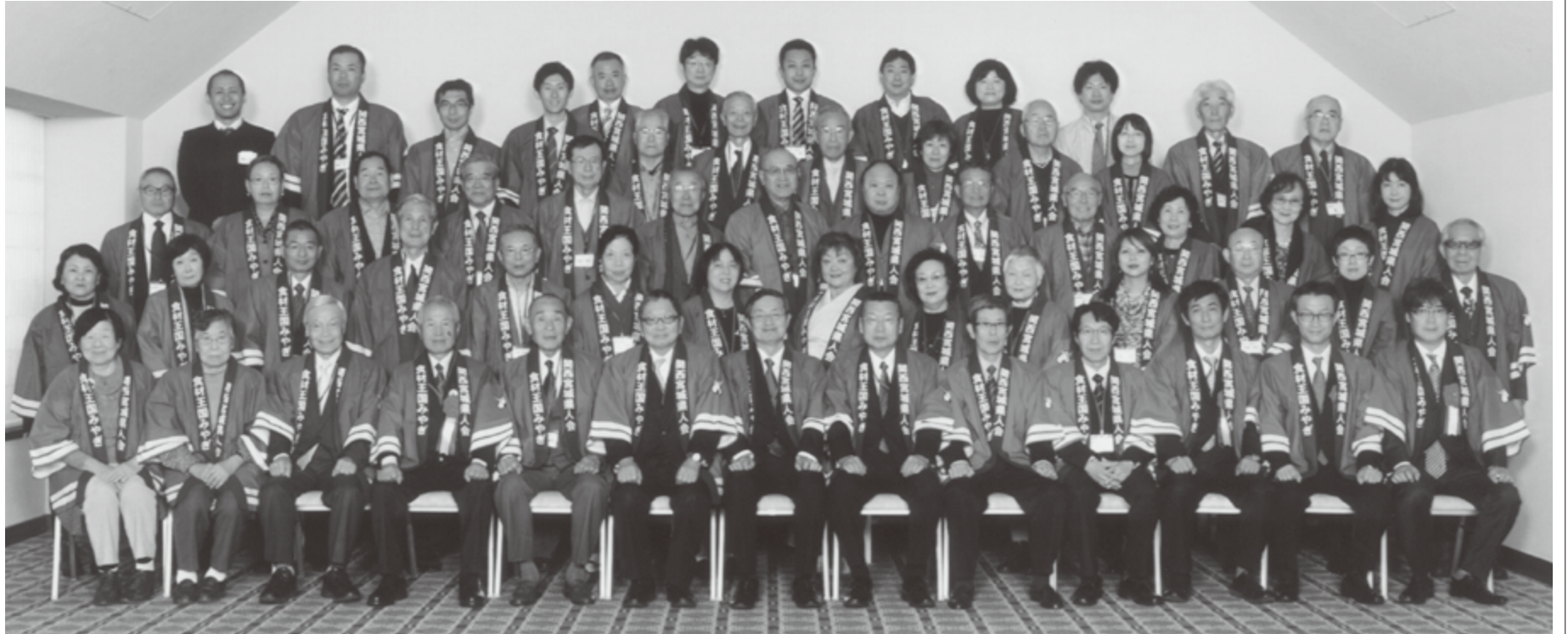
平成28年11月12日(土) 平成29年度 関西宮城県人会総会 於 ホテルグランヴィア大阪