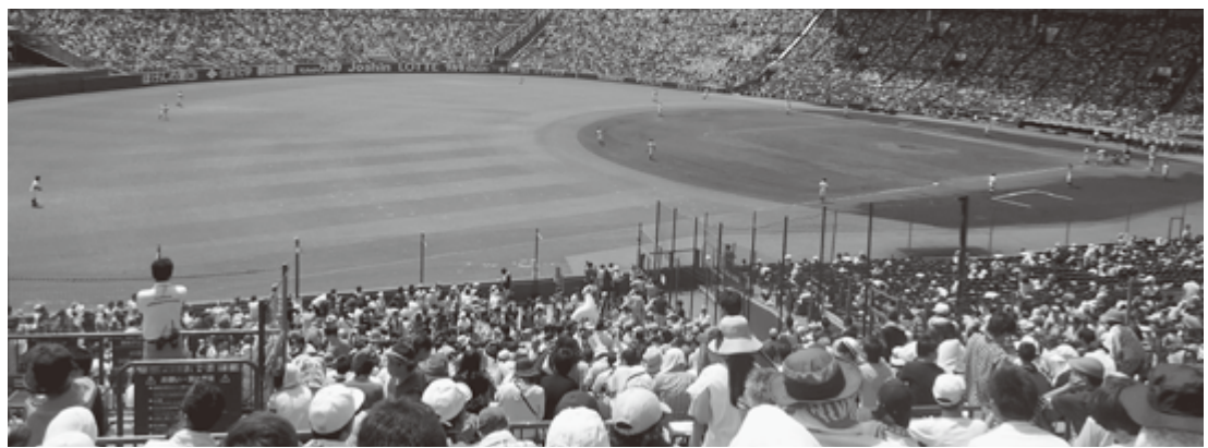
超満員の甲子園球場