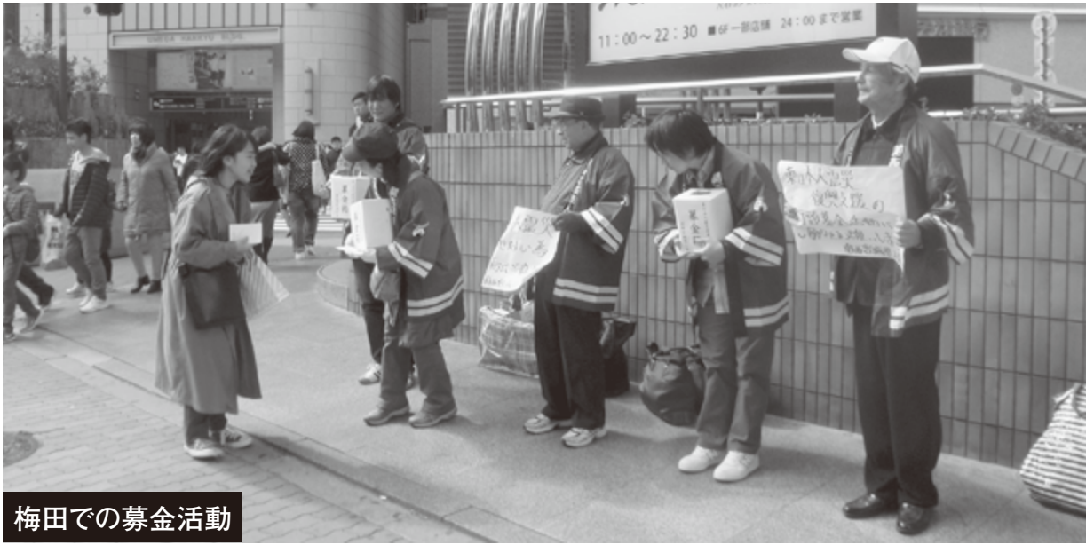
梅田での募金活動