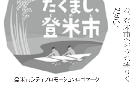
登米市シティプロモーションロゴマーク

登米市では、こうした食・自然文化や歴史などを情報発信する「シティプロモーション」の一環として、ロゴマークとPR動画を制作しました。PR動画「Go! Hat to (ハット)登米無双」は、これからも「うまし、たくまし、登米市」をキャッチコピーに、誰もが住みよいまちづくりに取り組んでまいります。ご帰郷の際にはぜひ、登米市へお立ち寄りください。