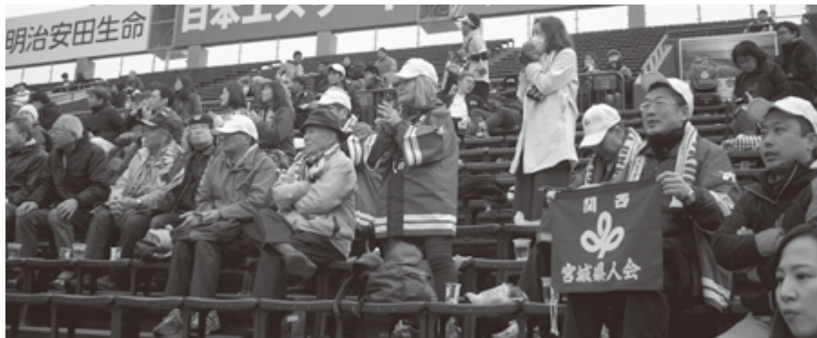
肌寒さの中、熱い応援