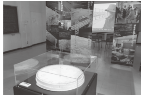
震災遺構 仙台市立荒浜小学校の展示の様子

関西宮城県人会の皆さまにおかれましては、ご健勝のことと心よりお喜び申し上げます。 仙台市では、東日本大震災の津波により被災した荒浜小学校の校舎を震災遺構として整備し、4月から公開を始めました。津波の爪痕が残る校舎をできる限りそのまま保存し、写真や映像なども加えて震災直後の状況や津波の脅威を伝えるとともに、震災前の荒浜地区の暮らしの様子や学校の思い出などを展示。これまでに全国から3万6千人以上の方が訪れ、震災の記憶や教訓を発信・継承する拠点となっています。