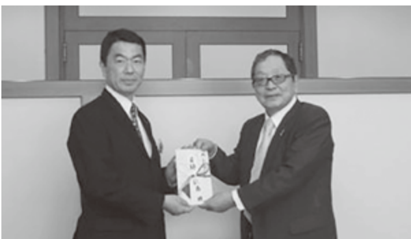
寄附金の贈呈 村井知事と佐藤会長(平成29年5月17日 宮城県庁)