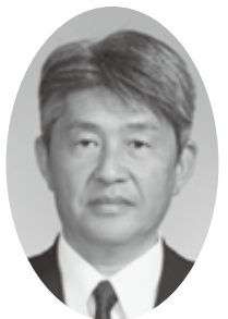
宮城県議会議長 中島源陽

平成二十八年十一月より、第四十二代宮城県議会議長を拝命しております中島源陽でございます。