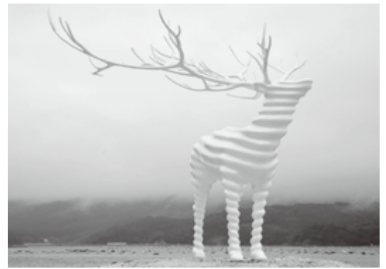
Reborn Art Festival 2017

込みであります。 現在、旧北上川の川沿いエリアでは、中心市街地の再生・賑わいの創出に向け、官民一体となり、川とまちを繋ぐ新たな空間と交流施設の整備に取り組んでおり、本年6月には地元産の生鮮食品を購入し、飲食できる、いしのまき元気いちばがオープンしました。 今後は、半島沿岸部における拠点エリア整備の加速化等、復旧・復興事業の早期完結を目指すとともに、復興後の持続的な発展を見据えた地方創生の礎づくりに取り組んで参ります。 また、今夏には、現代ア