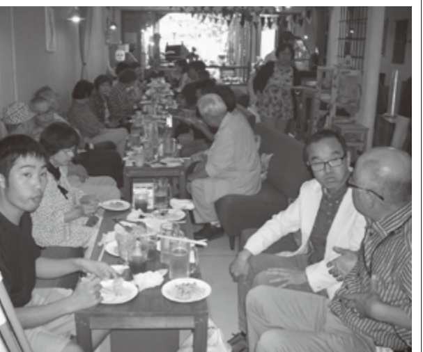
美味しいイタリアンで昼食

東日本大震災では、つらい出来事をユースで見て阪神淡路大震災を思い起こし、関西で自身が出来る支援をと思い募金活動などに参加をさせて頂いておりました。