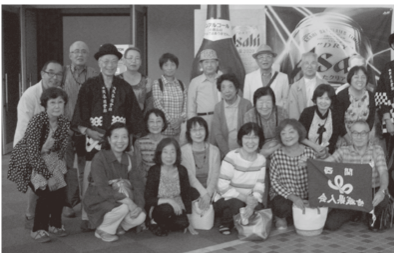
参加された皆さんによる記念撮影

次はお待ちかねの試飲会(普通のタンブラーで量もたっぷり)。まずはマイナスイオンが豊富な2度のエクストラコーールドを頂きます。出来立ては美味しい、一気飲み干しました。続いて『アサヒドライブレミアム・豊醸』と『アサヒスーパードライ・ドライブラック』を頂きました。しかしさすがに、試飲時間20分で3杯は厳しいです(笑)