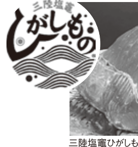
三陸塩竈ひがしもの

えて、先人から大切に受け継いだ自慢の郷土の復興を成し遂げるとともに、新しいまちづくりに取り組んでいく所存です。 まちの復興はまだ道半ばではございますが、二歩ずつ前に進む気