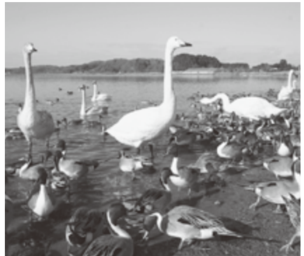
白鳥やマガンが多く飛来します

園の桜、夏は栗駒山からの絶景、秋は田んぼの稲刈り、冬は伊豆沼・内沼に飛来する白鳥やマガンなど、季節ごとにいろいろな顔があります。ホームページやフェイスブックでも最新の情報をお伝えしています。 栗原市は平成二十年岩手・宮城内陸地震で震度六強、東日本大震災で震度七を観測。停電、断水、家屋の被害などがありました。復旧・復興に市民が一丸となり、そして全国の皆様の温かいご支援により市民生活を