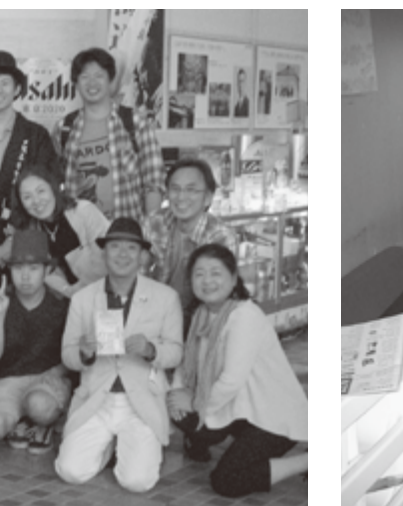
美味しいイタリアンで昼食

で、何といっても、シェフが郷土料理の『イクラと鮭のはらこ飯』を差し入れて頂いたときは、参加者から気持ちに感激の声があがりました。