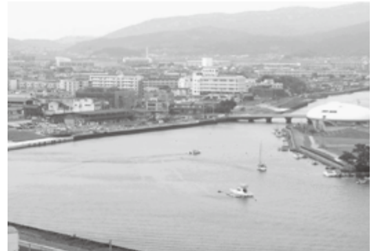
かわまち交流拠点整備 (H29.7.2撮影)

関西宮城県人会の皆さまにおかれましては、ますますご健勝のことと心よりお喜び申し上げます。 東日本大震災から6年7か月が経過しましたが、本市では、これまで住宅の再建を最優先課題として取り組んで参りました。土地地区画整理事業により整備した新市街地では、全ての地区において宅地供給が完了し、半島沿岸部におきましても、防災集団移転による宅地造成が今年度中に完了する予定であり、復興の持続的な発展を見据えた地方創生の礎づくりに取り組んで参ります。 また、今夏には、現代ア