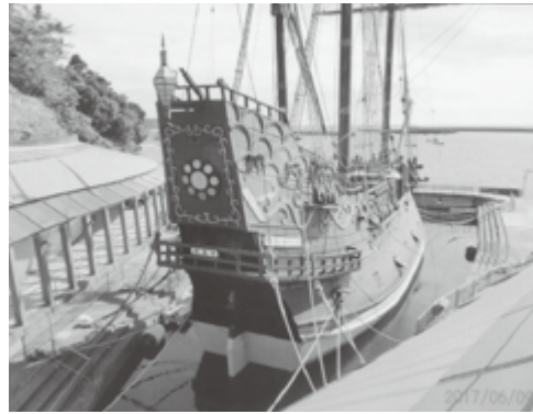
現在のサンファンパウティスタ号