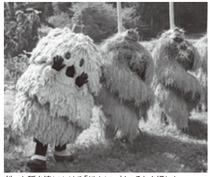
刈った稲を棒にかける「ほんによ」と、それを模した栗原市マスコットキャラクター「ねじりほんによ」