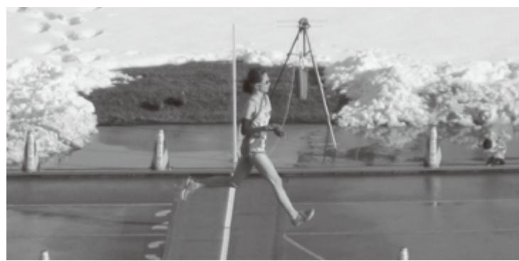
宮城県代表選手のゴール