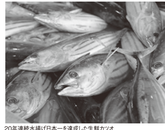
20年連続水揚げ日本一を達成した生鮮カツオ

整備が進められております。私たち市民は、これまでのご支援に対する感謝を忘れず、震災の悲しみを乗り越えつ前に進む気 仙沼の姿を実際に見て、感じていただくとともに、新鮮でおいしい海の幸を召し上がりに、帰郷の際はぜひ気仙沼市へお立ち寄りください。