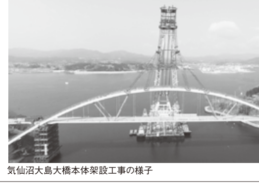
気仙沼大島大橋本体架設工事の様子