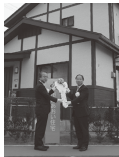
市営あおい住宅第一期入居式

ができる自立分散型低炭素エネルギーの実現を目指した東松島スマート防災エコタウン事業などにも取り組み始めました。このように、復旧・復興にとどまらない未来を見据えた創造的復興へと歩みを進めることができるのも、国内外の皆様からいただいた温かいご支援の賜物であり、ここに改めて深く感謝を申し上げます。