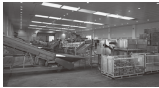
東棟内海外巻き網ゾーン