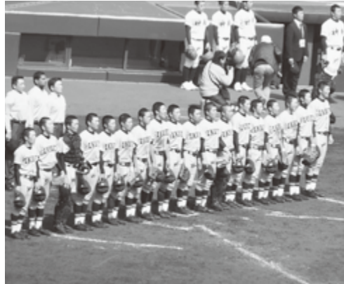
1回戦勝利・校歌斉唱