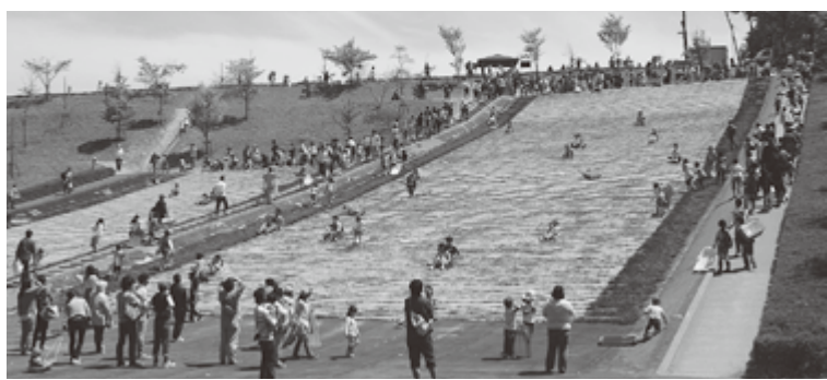
万葉クリエートパーク「そり滑り」

万葉集の中で詠まれている植物を主体とした園内には、昭和天皇御手植の松のほか「ひさかたの道」「かたかこの道」など、万葉の歌に縁のある名前の散策路が11本あり、その沿道には万葉歌碑48基建てられており、森林浴を楽しみながら、