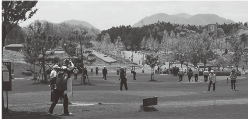
万葉パークゴルフ場

関西宮城県人会の皆さまにおかれましては、ご健勝のことと心よりお喜び申し上げます。また、昭和万葉の森に隣接し整備された万葉クリエートパークには、連日賑わう万葉パークゴルフ場があり、県内外のたくさんの方にプレーを楽しんでいただいております。