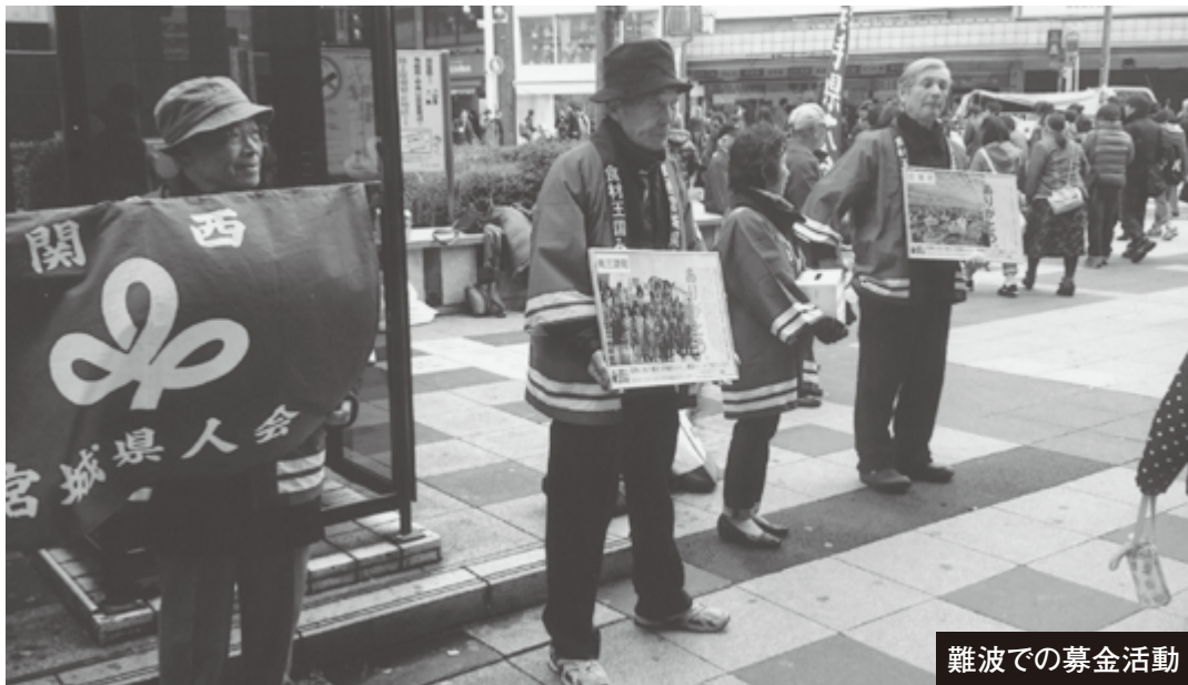
難波での募金活動