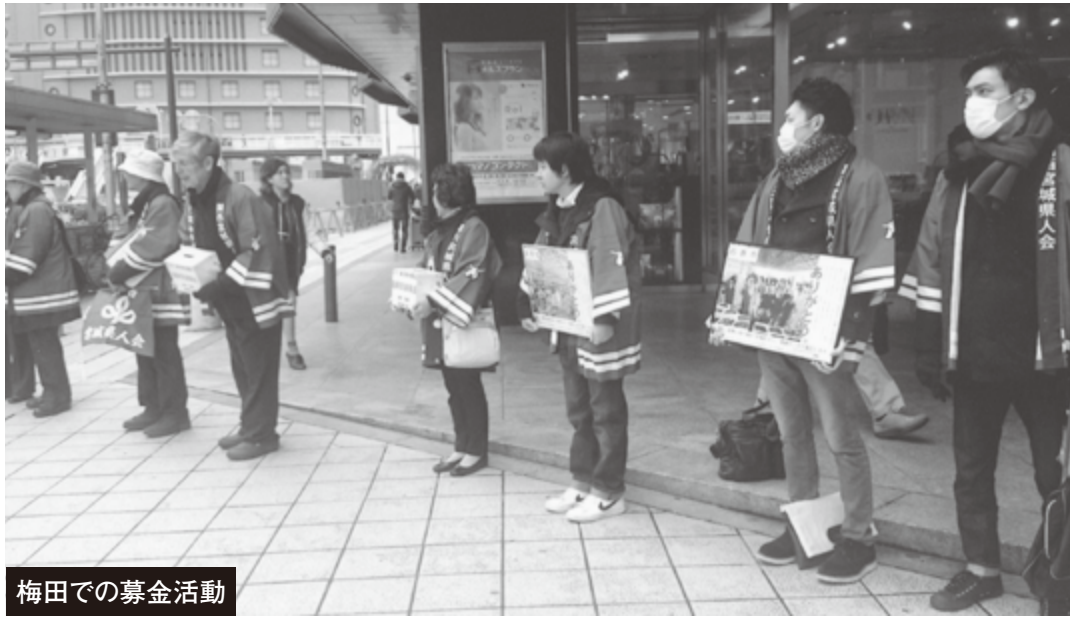
梅田での募金活動