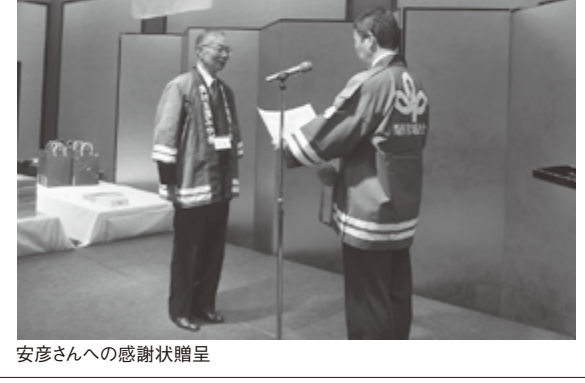
安彦さんへの感謝状贈呈