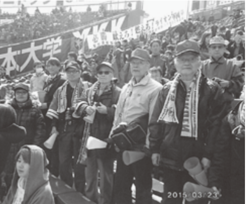
センバツ1回戦応援