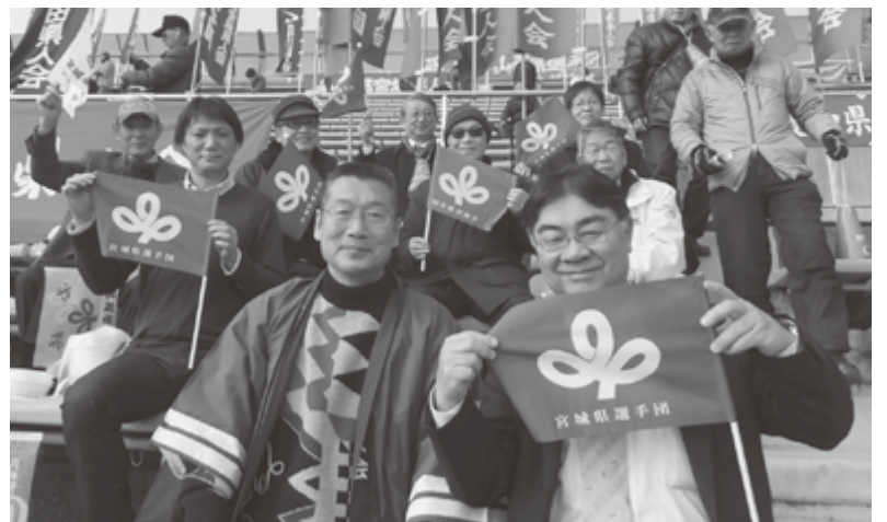
西京極陸上競技場での応援