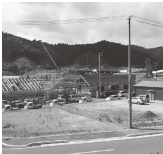
急ピッチで整備が進む駅前エリア