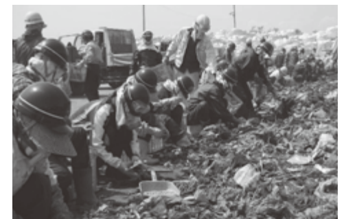
がれき処理の写真