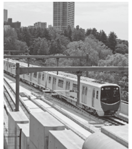
試験走行する地下鉄東西線

着駅・八木山動物公園駅までの13駅は、全駅舎が完成し、今は内装などの仕上げの段階です。車両の走行テストも始まりました。地域住民の駅舎見学会や、市民参加型のプロモーション「WEBプロジェクト」による東西線沿線を盛り上げるイベントも随時開催。仙台駅と市役所にはカウントダウンボードを設置し、開業を心待ちにしているところです。