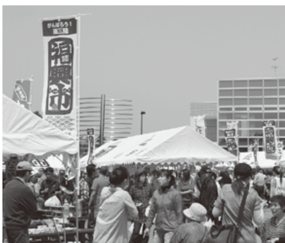
復興市（毎月行われている復興のイベントの賑わい）