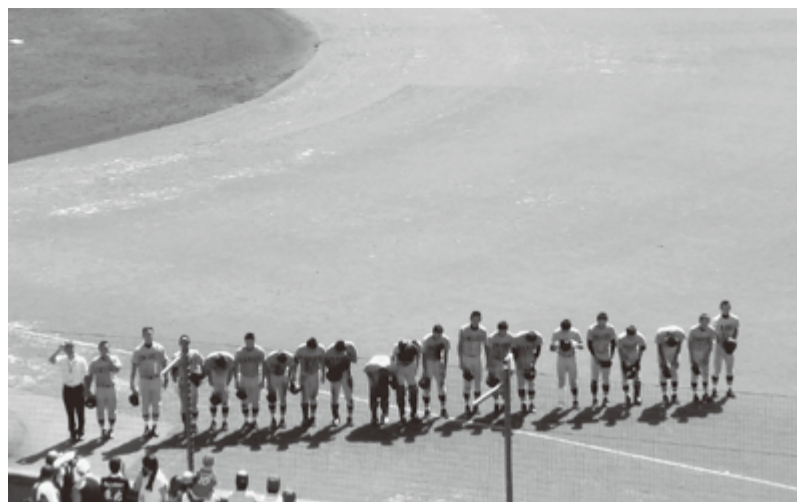
3回戦 応援団へのあいさつ 感動をありがとう