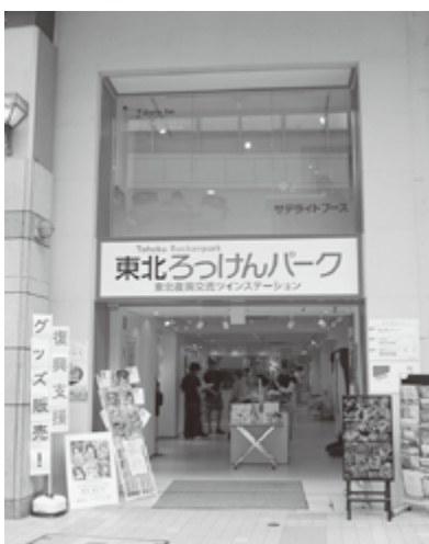
5月末にオープンした「東北ろっけんパーク」

関西宮城県人会の皆さまには、ますます「清潔なこととお喜び申し上げます。仙台市は、東日本大震災からの復興に向けて一歩一歩前に進んでいます。津波被害を受けた海岸部などが引き続き処理も進み、仙台市以外がれきの受け入れも始まっています。 1500世帯を超える防災集団移転事業や3000戸を目標とする復興公営住宅の建設も始まりま 5月には、震災の影響で昨年開催されなかった仙台国際ハーフマソン大会（愛称「杜の都ハーフ」と仙台・