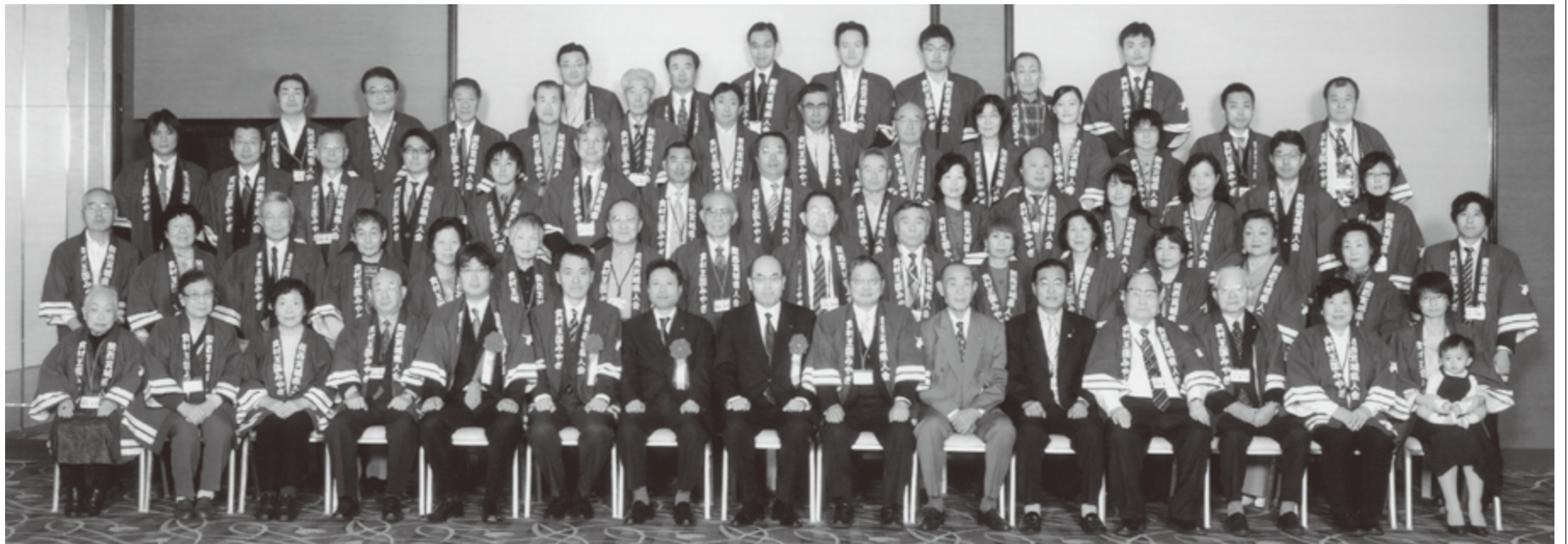
平成23年11月12日(土) 平成24年度 関西宮城県人会総会 於 ホテルグランヴィア大阪