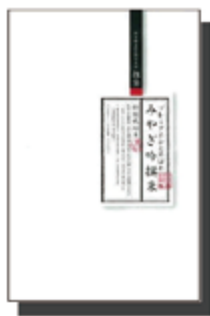
プレミアムひとめぼれ みやぎ吟撰米

農薬・化学肥料の使用を慣行栽培の半分以下に抑えた、自然環境に優しい「みやぎの環境保全米」です。