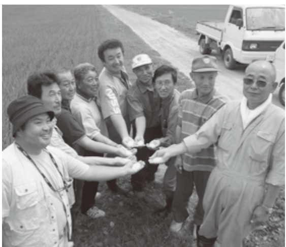
七ヶ宿源流米ネットワークのメンバー

また、平成22年9月には、「農事組合法人」を立ち上げ、「七ヶ宿ブランド」の「手塩にかけたお米」を「日本うまい米」売れる米にしようと、町も環境整備に取り組んで消費者の皆様へ愛されるお 最後に自然環境の豊かな「七ヶ宿ブランド」の「手塩にかけたお米」を「日本うまい米」売れる米にしようと、町も環境整備に取り組んで