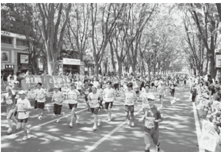
1万人規模の大会にリニューアルした「杜の都ハーフ」

城・仙台2012」が開催され、全国から8000人の選手・関係者が集い、熱気あふれるプレーが繰り広げられました。 東日本大震災の記憶は、被災地外では徐々に風化しつつあるようですが、仙台市内では今でも、1万世帯を超える方が応急仮設住宅で、不自由な生活を続けています。 観光も復興への大きな力となります。来年4月6日にはJリーグと「仙台・宮城ステイション・キャンペーン」を展開し、全国からの誘客を図ってまいります。 関西宮城県人会の皆さまも、復興に歩み続けるふるさと仙台の今を、自身の目で見て感じてください。ご来仙を心よりお待ちしております。