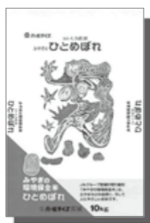
みやぎの環境保全米 ひとめぼれ

平成3年にデビューし、今や全国ブランドとなった踊る天女ひとめぼれは、米どころ宮城が生んだ代表品種として、幅広く多くの方から支持されています。