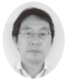
宮城県大阪事務所所長 (関西宮城県人会事務局長)