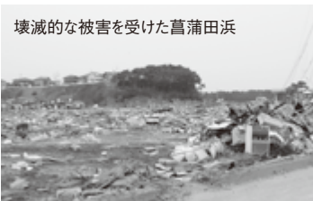
壊滅的な被害を受けた葛蒲田浜

「復興を誓って、前」というキャッチフレーズのとおり、復興(向かい)歩一歩力強く前進して参ります。なお、届のお力添えをお願い申し上げます。