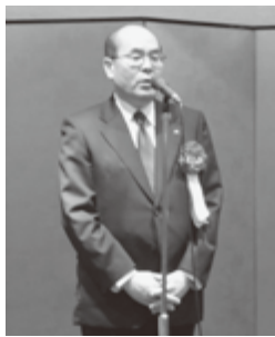
若生副知事あいさつ