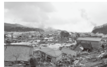
震災翌日の気仙沼市鹿折地区の様子(平成23年3月12日)

本市では昨年10月、復興への道しるべとなる「気仙沼市震災復興計画」を策定しました。計画の副題は「海と生きる」。これまで何度津波に襲われても海と関わり合って再起を果たしてきた先人を尊び、これからも海の可能性を信じて復興を成し遂げていこうという思いが込められています。