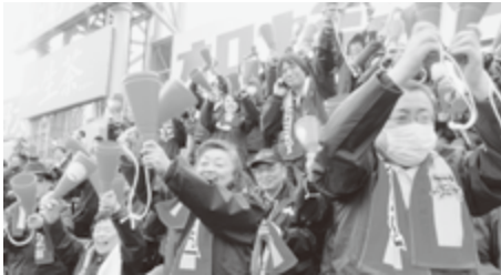
凄い石工! 割れんばかりの拍手と歓声がわき上がる