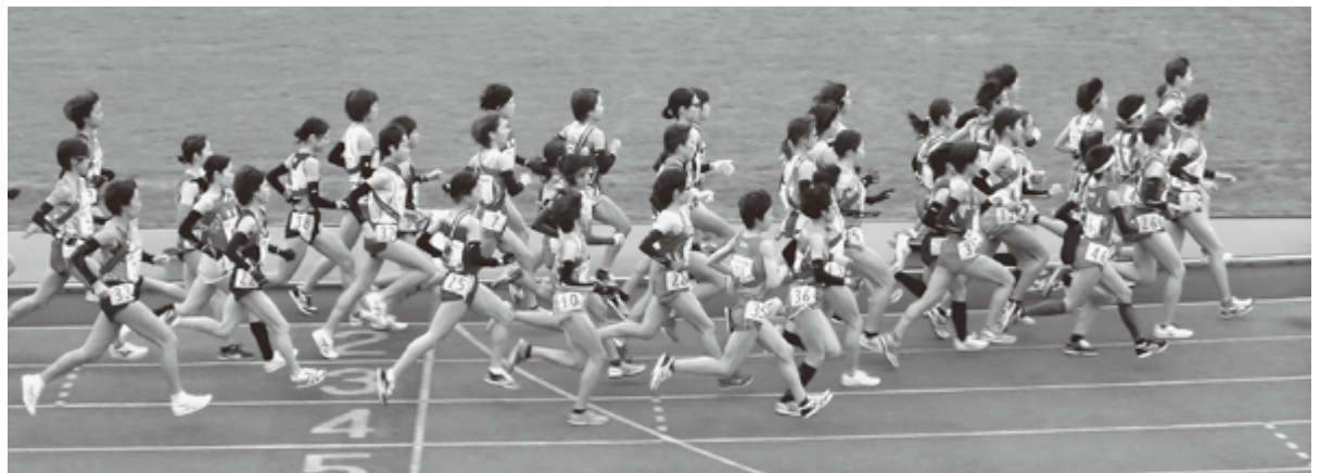
絆をつなぐ走りを見せられました