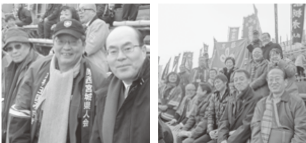
県人会応援団の皆さん

東日本大震災の被災地の一つ宮城県。その宮城県出身の代表選手達が走ります。宮城県代表選手達が力一杯走る勇姿を是非とも現地で見たいと思ひ応援に駆けつけました。