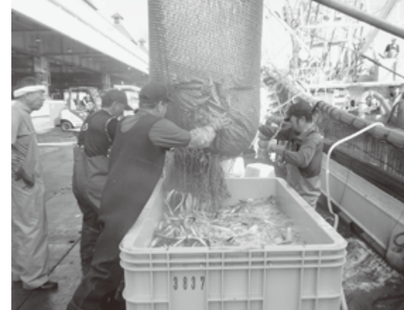
サンマの水揚げで活気付く気仙沼市魚市場(平成24年9月4日)