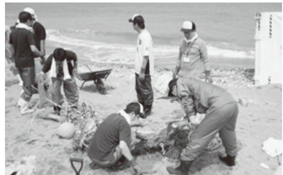
海浜清掃を行うボランティア