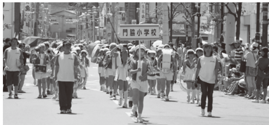
2年ぶりの子ども達の晴れ姿です