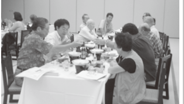
ふる里にいるような和やかなひとときを過ごしました