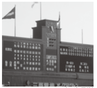
スコアボード(1回戦)