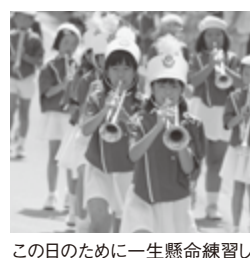
この日のために一生懸命練習しました