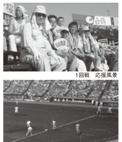
2回戦 プレーの様子