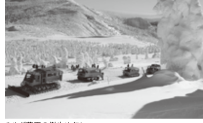
みやぎ蔵王の樹水めぐり

蔵王町の代表的な観光地である「御釜（おかま）」は、蔵王五色岳にある火口湖で、気候などの条件によってエメラルドグリーンや瑠璃色に湖面の色が変わり、豊かな表情を見せてくれる蔵王のシンボルです。蔵王刈田岳（さおうかりだだけ）の南西部に位置し、東北新幹線で東京駅から約2時間、仙台空港から車で約1時間と公共交通機関でのアクセスも整っており、宮城県でも仙台、松島に次ぐ観光地として県内、県外さらには海外より年間約180万人の観光客でにぎわって