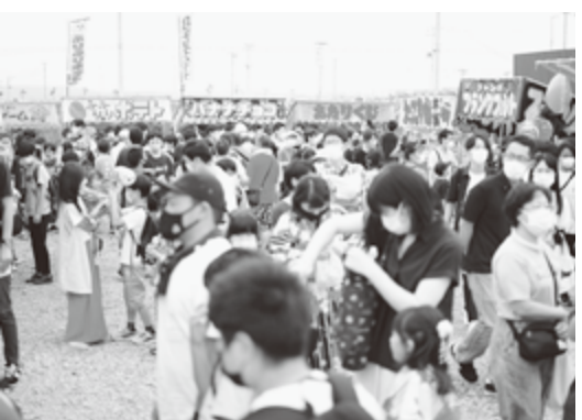
12年ぶりに閉上地区で夏まつりが開催されました。

豊かな自然に囲まれています。市沿岸部に所在する閉上地区は、東日本大震災で甚大な被害を受けましたが、まちの再建をすすめ、2019年に「まちびらき」が行われました。近年は更ににぎわいを増し、新鮮な魚介類を味わえる「ゆりあげ港朝市」や飲食店などが集まる「かわまちてらす閣上」、本格的なサイクリングやおもしろ自転車が楽しめる「サイクルスポーツセンター」などの観光