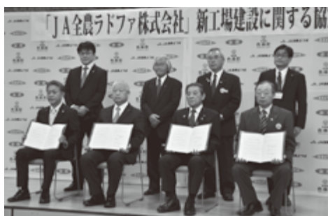
JJA全農ラドファ株式会社を誘致

いぎなり うめえ よしこの 牛たん 吉次 〇鰯谷店 〇心斎橋店 〇本町店 〇北新地店 大阪市北区曾根崎新地1-11-11 営業時間 ランチ 11:30~14:00 ラストオーダー 夜 17:30~2:00 ラストオーダー ※土曜は夜のみ営業 TEL 06-4256-8606 定休日 日・(祝)