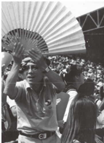
ある時の夫の応援スタイル

八月二十二日、仙台育英高校が見事に初優勝。塩竈市出身の夫は、春夏の大会、甲子園に必ず足を運び、時には「敵に勝て」とカツ用の