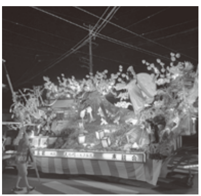
豪華な山車が練り歩く「くろこま山車まつり」