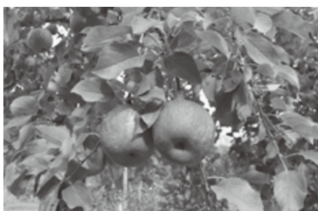
南山果樹園のりんご