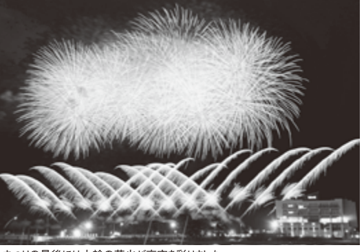
まつりの最後には大輪の花火が夜空を彩りました。

スポーツが豊富で、活気に満ち溢れます。今年8月、東日本大震災以降、場所を移して行われていた「なとり夏まつり」が12年ぶりに閉上地区で開催されました。当日は、地元で活動する団体などが夏まつりを盛り上げるとともに、多くの模擬店が出店し、たくさんの方で賑わいました。鎮魂の思いと復興に支障いただいた方々への感謝の意を込めて開催されたなとり夏まつり。ファイナルの花火では、約1万発の花火が打ち上げられ、閉上の空を大輪の花が彩りました。結びに、貴会のみますまの御発展と会員皆様のご健勝を心よりお祈り申し上げます。