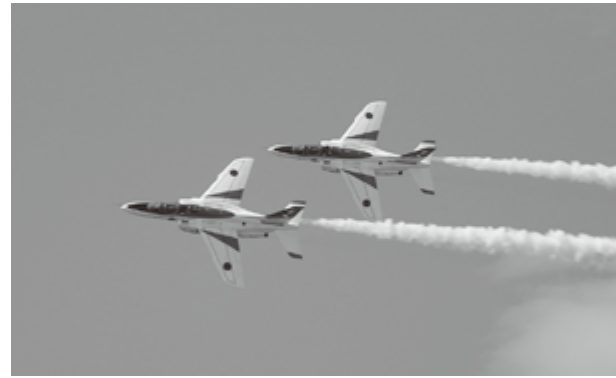
ブルーインパルスの展示飛行

賑わいました。さらには、8月27日、28日には3年ぶりに「東松島夏まつり」と「航空自衛隊松島基地航空祭」が開催されま