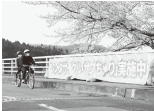
レンタサイクル「サブチャリ」

まれた自然と歴史と文化の豊かな町です。本町では、セツ森湖畔周辺の豊かな自然の中を自転車や自由に乗し、