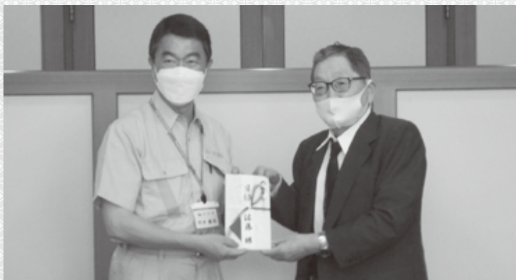
寄付金の贈呈 村井知事と佐藤会長(令和4年7月20日 宮城県庁)