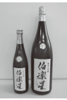
宮城を代表する日本酒「伯楽星」。世界中から高く評価される「SAKE」は、川崎町の清らかな水をふんだんに使用して作られています。

を含む県南地域2市9町の庭園などで構成する「みやぎ蔵王六十七回廊」が東北で初めて国のガーデンツーリズム制度に登録されました。町内では「船岡城址公園」や、個人宅のお庭を公開する「しばたのオープンガーデン」がこのオープンツーリズムの周遊コースに含まれています。