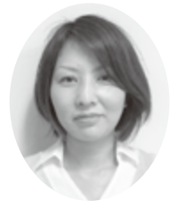
宮城県大阪事務所所長代理 (関西宮城県人会事務局長)