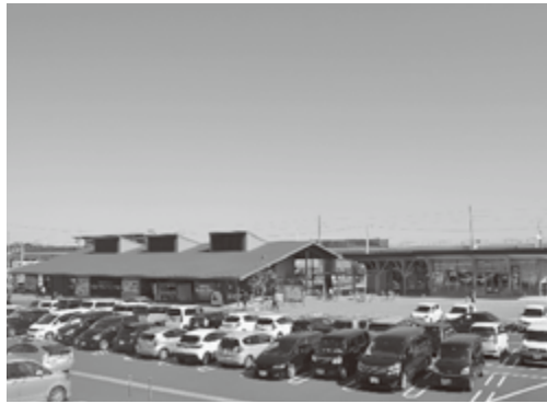
連日大盛況の「やまもといちごの郷」

包まれました。会員の皆様には四季折々、魅力あふれる山元町にご来訪頂きますよう心からお待ち申し上げますとともに、貴会の益々の発展と会員の皆様のご健勝をお祈り申し上げます。