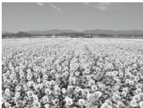
広大な農地一面に咲き誇るひまわり

用のヒマワリの開花期間中を活用し開催しており、今年で5回目を迎えました。会場となった約55ヘクタールの広さを誇る沿岸部の農地は、二面に咲き誇る約200万本のヒマワリで、思わず息をのむ絶景に