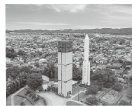
H2ロケット実物大模型とスペースタワー・コスモハウス

また当市では、地場産品のPRと「安心して、いきいきと、誇らしく暮らせるまち」実現のため、特設サイトへ是非お越しいただき、当市をふるさと納税で応援ください。