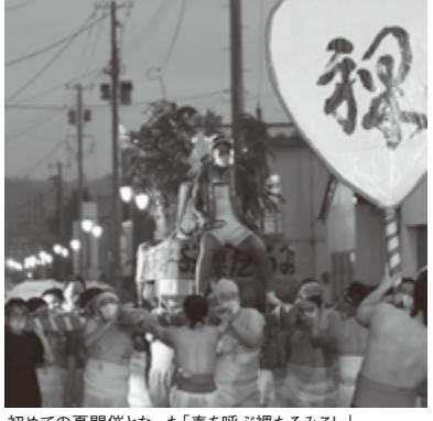
初めての夏開催となった「春を呼ぶ探るみこし」

にあり、市内各地で伝統あるお祭りが開催され、久しぶりに賑わいが戻ってまいりました。3年振りに開催された「くろこま山車まつり」では、栗駒の各地区で数か月かけて作成した豪華な山車が、栗原の夜を鮮やかに彩り、第57回を数える中で初の夏開催となりました。この「春を呼ぶ探るみこし」では、無病息災や五穀豊穡を願い、沿道からの力水を受けながら、勇ましく練り歩きます。こうしたお祭りは、コロナ禍が続く中でも、伝統