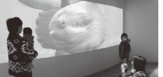
マンボウを主役にしたプロジェクションマッピング

年、三陸沿岸道路が全線開通し、仙台市や他県とのアクセスが向上したことで他の地域からさらにお越しいただきやすくなりました。 昨年3月には道の駅「大谷海岸」がリニューアルし、休日を中心に多くの方に、お越しいただいています。道の駅には、地元産の食材や物産品が多数並び、産直市場、道の駅オリジナルメニューが楽しめるカフェ・カクテル・テラス、海岸が見える屋上デッキ、マンボウを主役にしたプロジェクションマッピングなどがあり、世代を問わず楽しむことができます。