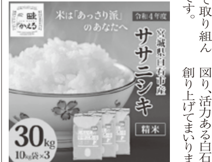
▲白石市自慢の逸品達(上)フロンティア Hybrid スーパーマルチアイス 中/JAPAN X 豚小間 & 家庭用牛タンセット 下/白石産のササニシキ

さらに、令和7年度に向けて、(仮称)白石中央スマートインターチェンジとその周辺に工業団地や道の駅などの整備を進めることで、産業・観光・移住定住などの様々な分野で「新たな価値の創造」につながるものと期待しています。