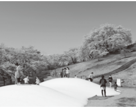
子どもたちの遊び場として賑わう柴田町太陽の村

を含む県南地域2市9町の庭園などで構成する「みやぎ蔵王六十七回廊」が東北で初めて国のガーデンツーリズム制度に登録されました。町内では「船岡城址公園」や、個人宅のお庭を公開する「しばたのオープンガーデン」がこのオープンツーリズムの周遊コースに含まれています。