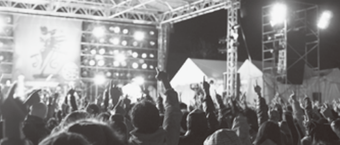
例年約6万人が集まるアラバキロックフェスティバル。今年は規模を縮小しましたが、3年ぶりの開催に来場者から感謝の声が多数寄せられました。