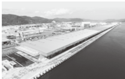
石巻市水産物地方卸売市場石巻売場

今年八月には、本市最大の夏まつり「第九十九回石巻川開き祭り」を開催。三年ぶりに小学校鼓笛隊、パレードや孫兵衛船競漕、花火大会といった主要行事が行われ、市内外から参加された皆様の笑顔で街が活気づ