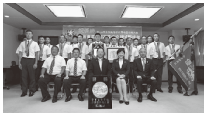
仙台育英学園高等学校硬式野球部に「賛辞の楯」を贈呈

今年8月、とても嬉しいニュースが宮城を駆けめぐりました。第104回全国高等学校野球選手権大会で、仙台育英学園高等学校硬式野球部が見事優勝。初戦から全員野球で勇往邁進し、東北の悲願「白河の関越え」を成し遂げたその姿は、多くの感動を届けてくれました。本市ではこの活躍と栄誉をたたえ、同校硬式野球部に対し「賛辞の楯」を贈呈いたしました。 今年8月、とても嬉しいニュースが宮城を駆けめぐりました。第104回全国高等学校野球選手権大会で、仙台育英学園高等学校硬式野球部が見事優勝。初戦から全員野球で勇往邁進し、東北の悲願「白河の関越え」を成し遂げたその姿は、多くの感動を届けてくれました。本市ではこの活躍と栄誉をたたえ、同校硬式野球部に対し「賛辞の楯」を贈呈いたしました。