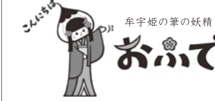
角田市牟宇姫PRキャラクター