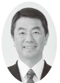
ごあいさつ 宮城県知事 村井嘉浩

関西宮城県人会の皆様には、日頃からふるさと宮城の振興と発展のため、格別の御支援と御協力を賜り、厚く御礼申し上げます。