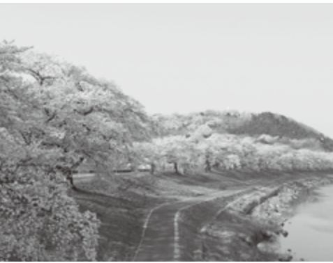
令和5年に植樹100周年を迎える白石川堤の桜並木