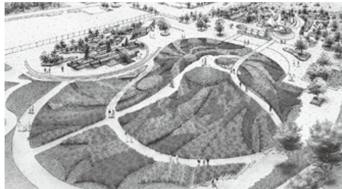
全国都市緑化仙台フェア 大花壇「はなばた飾り」(イメージ)

望んだ、杜の都を彩るまつりやイベントを「3年ぶり」という冠を付して実施することができました。青葉薫る5月には仙台国際ハーフマラソン大会、仙台青葉まつりが開催され、夏の風物詩・仙台七夕まつりにはコロナ禍前と同程度の225万人が来訪されました。ウイズコロナにおけるイベントのあり方として、感染対策を講じながらできることを増やしていき、市民、事業者、観光客等、皆さまの協力により、まちにぎわいが戻ってきたことを非常に嬉しく思います。