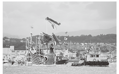
鮮やかな大漁旗や吹き流しが海に映える「海上渡御」は威風堂々

の厳島神社の管弦祭、神奈川県の貴船神社の貴船まつりと共に「日本三大船祭り」に数えられ、海の祭典として全国有数の規模を誇ります。 祭のクライマックスは、2基の御神輿が再び鹽竈神社表参道(表坂)の202段の石段を上り神社に帰る「還御」です。御神輿の重さは1トンもあり、傾斜が急なため、担ぎ棒は一般的な御神輿よりも短く、担ぎ手一人あたりにかかる重さは60kgにもなります。担ぎ手たちを鼓舞する