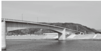
石巻かわみなと大橋